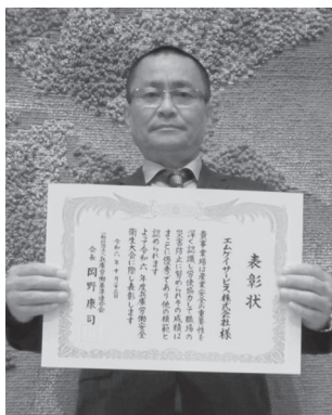
エムケイサービス(株)様

この度は、安全関係優良事業場として、兵庫労働基準連合会会長表彰を受賞する栄誉にあずかり厚く御礼申し上げます。