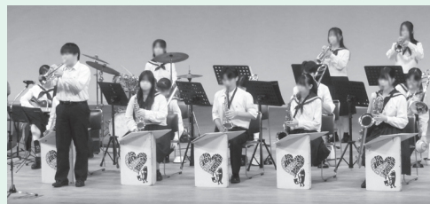
アトラクション：高砂高校ジャズバンド部