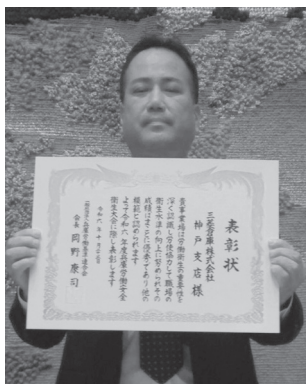
三菱倉庫(株)神戸支店様

この度、労働衛生関係優良事業場として、兵庫労働基準連合会会長表彰という大変名誉ある賞をいただき、厚く御礼申し上げます。