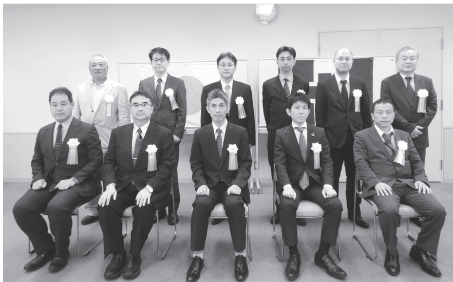
役員・受賞者集合写真